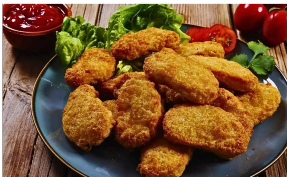
Nuggets caseiros distribuídos no horário de almoço.

TENTE FAZER NA SUA CASA, POSTE UMA FOTO NO INSTAGRAM E MARQUE A CAV