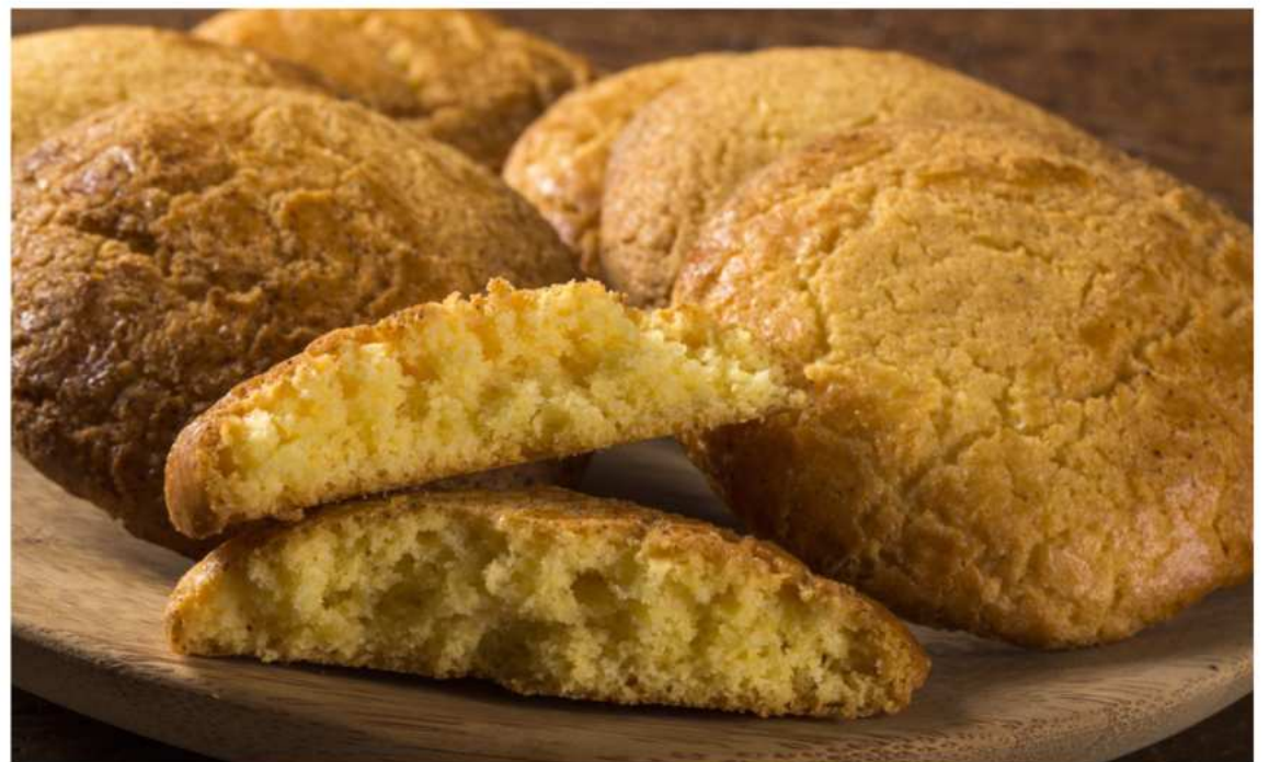
Broinhas de milho distribuídas no lanchinho da tarde.

TENTE FAZER NA SUA CASA, POSTE UMA FOTO NO INSTAGRAM E MARQUE A CAV